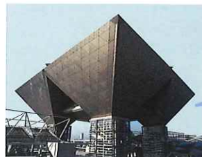
会議棟6階 セミナー会場

※事前申込制、お支払いは銀行振込みのみとなります。当日席、現金払いはございません。詳しくは弊社Webサイトをご覧ください。