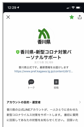
①香川県LINE公式アカウントに友だち登録