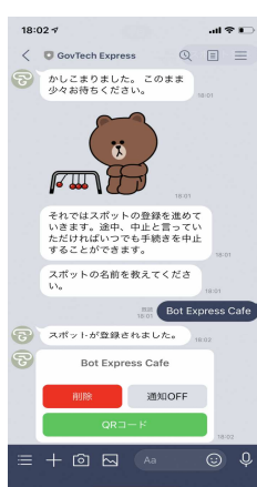
③店舗名称等の質問に回答していくとQRコードを掲載した様式が発行されます。