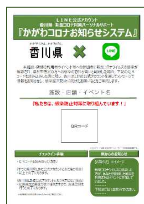
④印刷して店舗等に掲示してください。