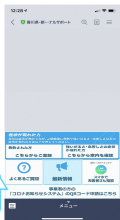
②トーク画面下部の『事業者の方のコロナお知らせシステムのQRコード申請はこちらから』をタップ。