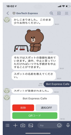
③店舗名称等の質問に回答していくとQRコードを掲載した様式が発行されます。