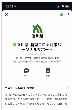
①香川県LINE公式アカウントに友だち登録