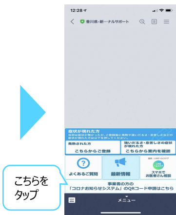
②トーク画面下部の『事業者の方のコロナお知らせシステムのQRコード申請はこちらから』をタップ。