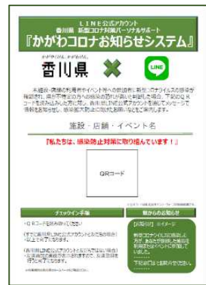
④印刷して店舗等に掲示してください。