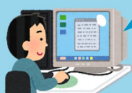
システムへログイン