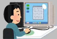
様式をダウンロード