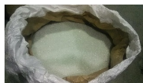
破碎・選別したガラス