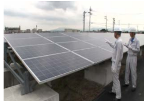
太陽光パネルの外観検査

使用済みとなった太陽光パネルについても、再販売可能なものもある。既に多くのリユース事例が報告されている。