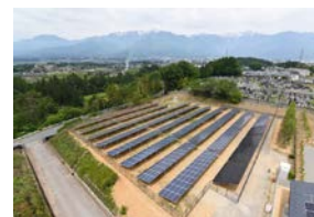
リユース品を使用した発電所