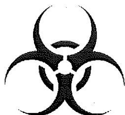
バイオハザードマーク