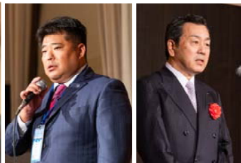
挨拶する沖川青年部協議会会長（写真左）と永井連合会会長（写真右）

全国産業資源循環連合会青年部協議会「第10回カンファレンス全国部会長会議」を11月14日にANAクラウンプラザホテル神戸で開催しました。