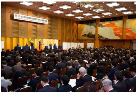
全国大会の開会式のもよう

第18回産業廃棄物と環境を考える全国大会（主催・公益社団法人全国産業資源循環連合会、公益財団法人日本産業廃棄物処理振興センター、公益財団法人産業廃棄物処理事業振興財団）を11月15日に兵庫県神戸市のホテルオークラ神戸で開催しました。