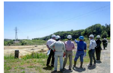
都築鋼産株式会社の見学会