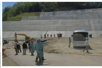
参加メンバー（写真左）と、ひめゆり総業株式会社の見学会（写真上）