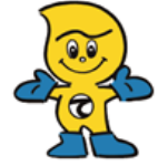
産業廃棄物処理法基礎のマスコット「てき丸君」