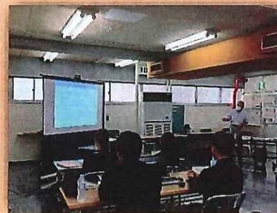
令和5年度セミナーの様子

(事業所の取組具合にもよりますが、例年、 最短で7ヶ月程度 で認証取得に至っています。)