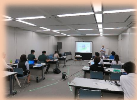
令和4年度セミナーの様子

(事業所の取組み具合にもよりますが、例年、最短で7ヶ月程度で認証取得に至っています。)